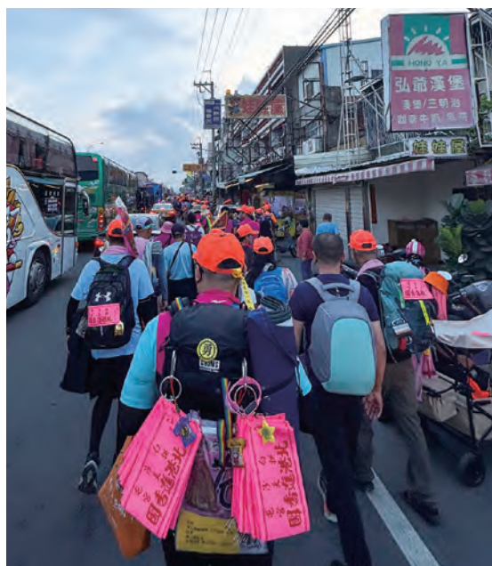
信眾跟隨白沙屯媽祖徒步進香

今年白沙屯媽祖進香最令人印象深刻的事情，在於媽祖踏上了 200 年曾未進入的南投縣！5/6 當日午後媽祖的路線就備受關注，尤其南投竹山鎮與彰化二水鄉的