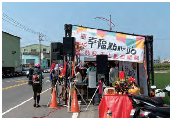
幸福點心站協助發贈結緣品 - 勝昌金門一條根貼布

臺灣外銷日本第一的中藥品牌—「勝昌製藥」，為國內首家通過三階段確效查核的中藥濃縮製劑廠，始終秉持「人命至重」的精神，與媽祖普渡眾生的理念一致，透過參與媽祖遶境活動，致力於推廣新漢