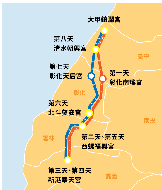
乙巳年大甲媽祖遶境進香路線圖

用的華蓋，為媽祖沿途遮陽、歇息之用。令旗位於媽祖鑾轎兩側，有鎮煞驅魔之用。核心的媽祖鑾轎由藤編轎身與木雕底座構成，信眾爭相「鑽轎腳」祈求平安、驅病除厄。自行車隊身為交通整隊組，整齊畫一，極富朝氣。