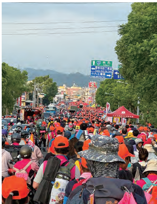
數十萬信眾追隨媽祖進香

實每個人態度對了無論進香還是繞境，無論白沙屯還是大甲媽，您在隨行的上，都會感受到媽祖對您的疼惜。