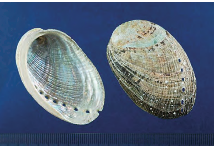
圖 1 石決明飲片圖 (未碾碎前)