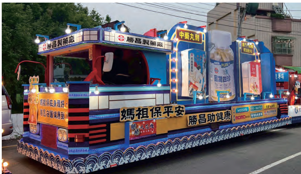
勝昌製藥廠漢方花車，護航大甲媽祖遶境