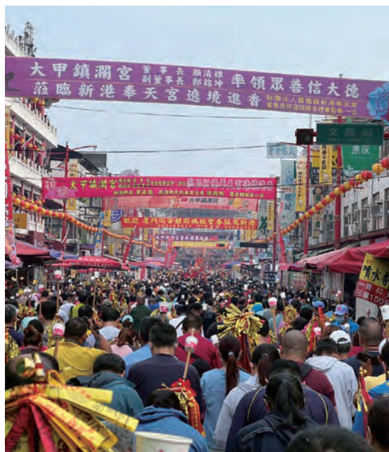
乙巳年大甲鎮瀾宮遶境進香祝壽大典

十、「安座典禮」— 最終，在九天八夜的長程即將落幕之際，媽祖回到鎮瀾宮登殿入座，信眾叩謝媽祖庇佑，為年度盛事畫下圓滿句點。