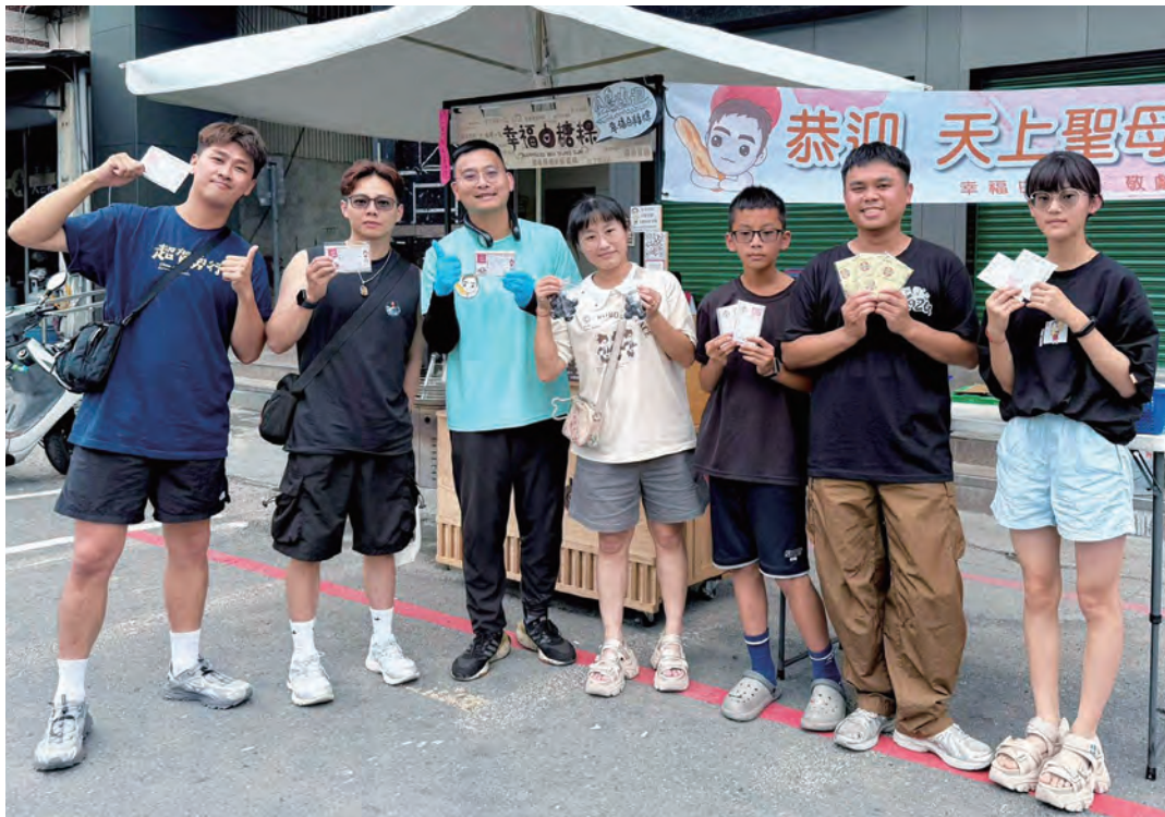
感謝幸福白糯米點心站協助發贈結緣品 - 勝昌金門一條根貼布

今年的白沙屯媽祖進香，勝昌感謝粉絲們、通路夥伴們在 5/5 下午兩點、5/6 早上六點半，一路收看我們的直播！在烈日下我們願意代替你的雙腳，與粉紅超跑一同前行，也因為這個直播，讓很多粉絲知道我們都是玩真的，公司裡也充滿著被媽祖懷抱的氛圍，其實每個人態度對了無論進