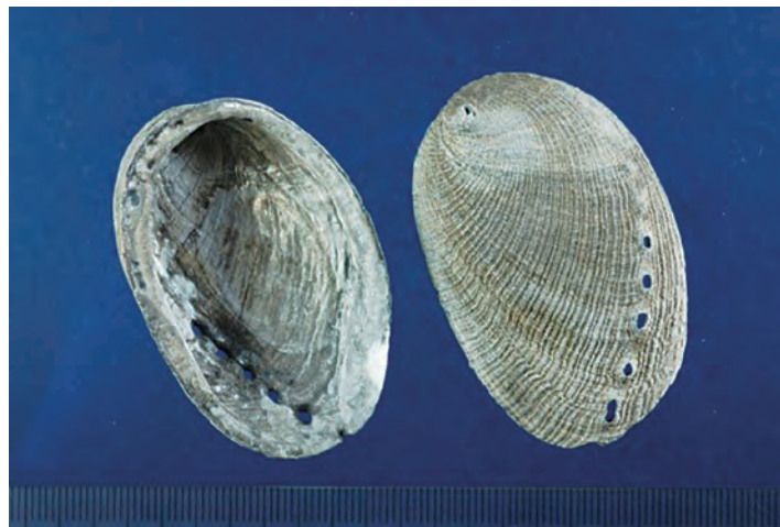
圖 2 煅石決明飲片圖 (未碾碎前)

孔口與殼面平。內面光滑，具珍珠樣彩色光澤。殼較厚，質堅硬，不易破碎。碾碎後的飲片為不規則的碎塊，灰白色，有珍珠樣彩色光澤，質堅硬，氣微，味微鹹 1,2 。