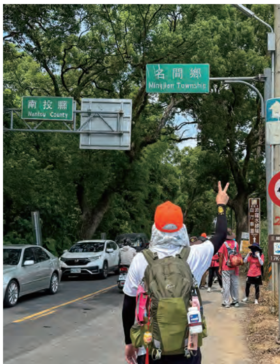
媽祖 200 年來首度前往南投