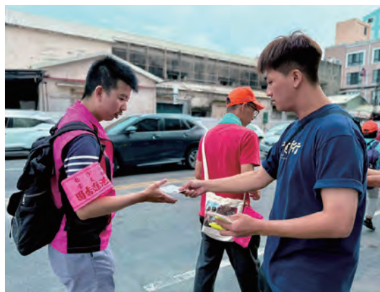
發贈結緣品慰勞辛苦的香燈腳們

過去，我們跟隨媽祖的行動總是默默前行，也因為大家的支持和鼓勵，今年我們將整個過程呈現給大家，一直以來我們都希望用最接地氣的方式，與大家一起打拼中藥產業。如今追隨媽祖也告一段落，勝昌很感謝白沙屯媽祖、山邊媽祖、大甲媽祖對我們的庇佑，我們也會繼續秉持嚴謹製藥精神，用家人的關愛救人濟世。感謝幸福白糖粿愛心團隊、找廟公團隊與勝昌製藥一起發送愛心福品，提供大家最直接的行動補給！最後我們想對大家說，其