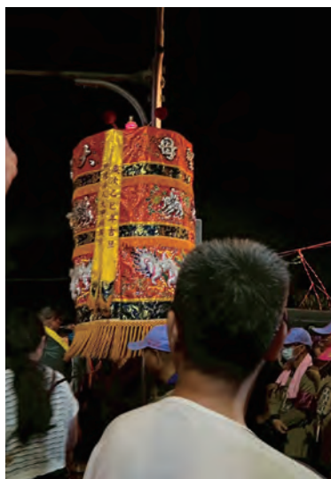
左至右分別為：報馬仔、開路鼓及媽祖轎前的涼傘。