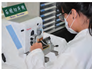
● 藥材基原鑑定(組織切片)