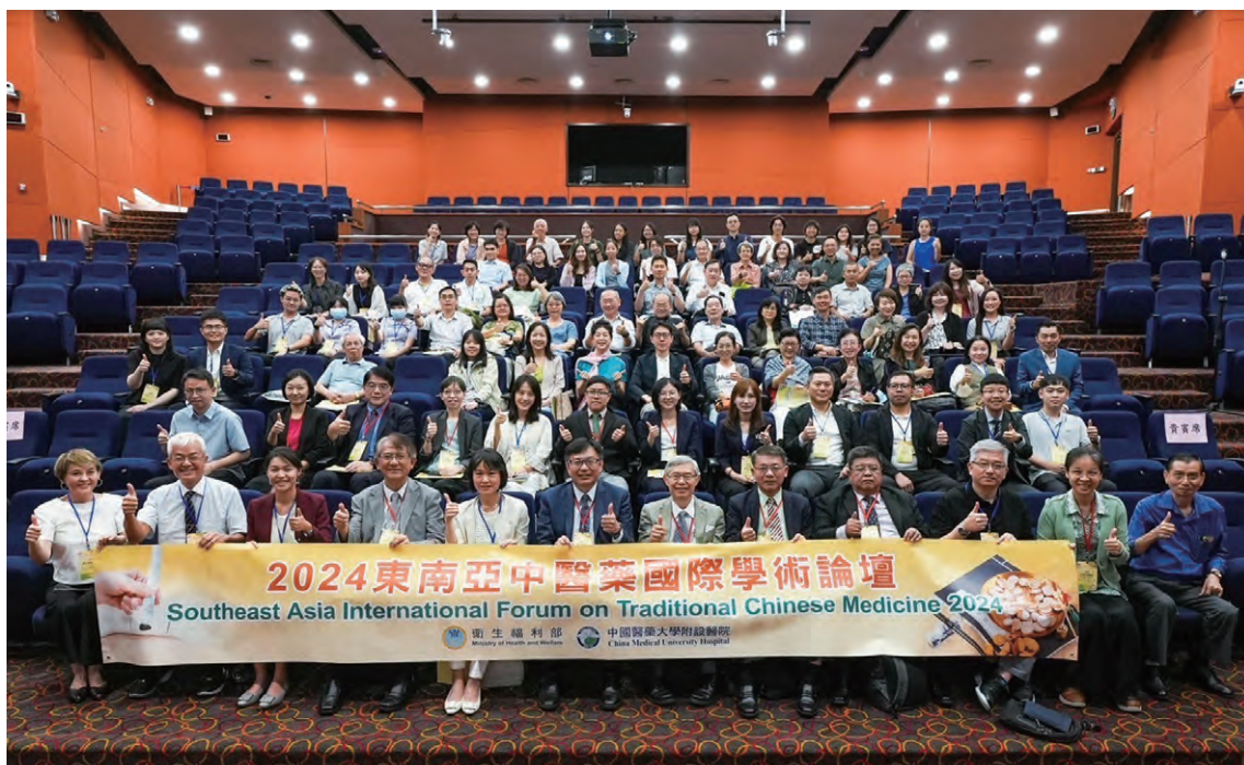
2024 東南亞中醫藥國際學術論壇合照