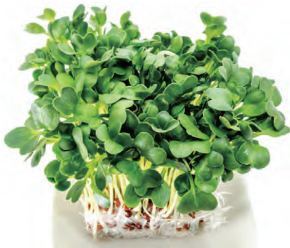
蘿 蔔 嬰

小麥草性微寒，脾胃虛寒或腹瀉者應避免過量食用。部分人對小麥草過敏，食用前需注意。小麥草的強排毒作用可能引起短暫的頭暈、噁心等排毒反應，建議從少量開始食用。