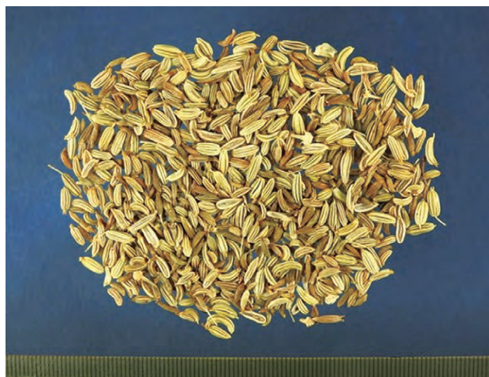
圖 2 鹽小茴香飲片圖

5 條，接合面平坦而較寬。橫切面略呈五邊形，背面的四邊約等長。有特異香氣，味微甜、辛 1,2 。