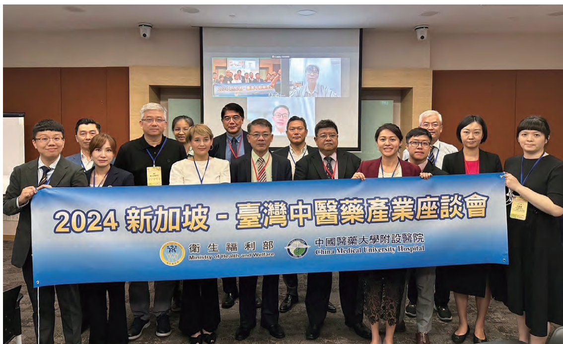
2024 新加坡 - 臺灣中醫藥產業座談會合照