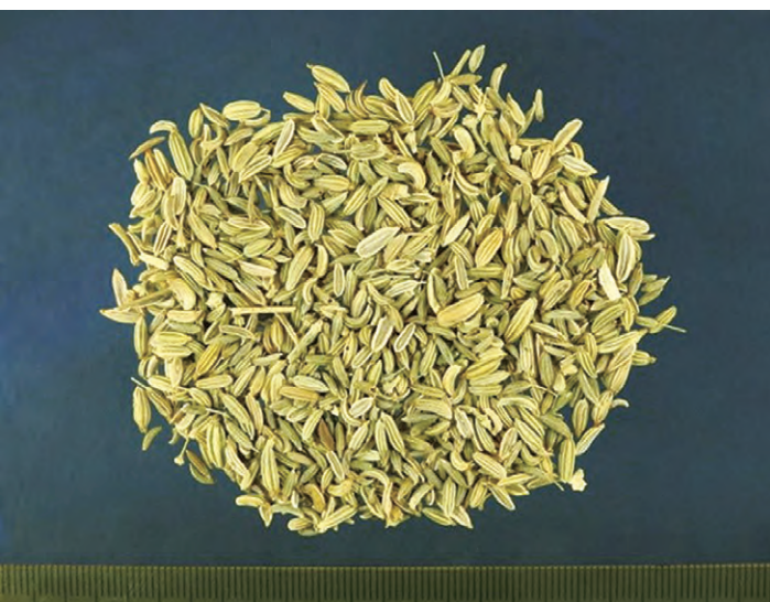
圖 1 小茴香飲片圖