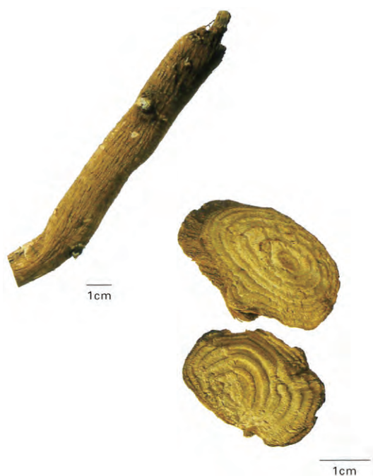
商陸飲片圖。 圖片來源：當代藥用植物典 (2)